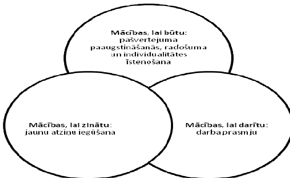
1.attēls. Izglītības ieviešana (Educational Introduction, 2009)

Izglītības funkciju parasti ir izprot kā iespēju nodrošināšanu bērniem un jauniešiem konkrētajā reģionā iegūt pilnīgus un pilnvērtīgus izglītības pakalpojumus, tātad iespēju iegūt likumā paredzēto izglītību. Mazāk uzmanības tiek pievērsts pieaugušo izglītībai kā mūžizglītības daļai. Taču mainīga darba tirgus apstākļos mūžizglītība iegūst aizvien lielāku nozīmi, tas ir līdzeklis, kā pilnveidot esošās un attīstīt jaunas profesionālās kompetences (skatīt 1.attēlu).