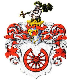
von und Baron Fölkersahm und von Völkersahm. Abbildung 3. Wappen der Familie von Fölkersahm [ https://de.wikipedia.org/wiki/Datei:F%C3%B6lkersahm.jpg ]